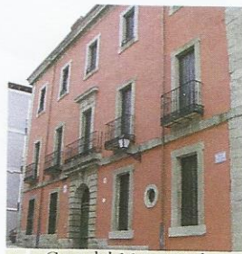
Casa del Marqués de Campovillar

y D. Francisco de Paula (5), obra atribuida a Juan de Villanueva, que data del año 1792. Declarado Bien de Interés Cultural, en la actualidad acoge el Euroforum Infantes, sede de los Cursos de Verano de San Lorenzo de El Escorial. En la misma carretera de la estación, situamos el Parador Nuevo (6) obra también de Juan de Villanueva. Espacio dedicado a varias funciones es, en la actualidad, un edificio de viviendas que se sitúa en las proximidades del reciente Teatro-Auditorio de San Lorenzo de El Escorial.