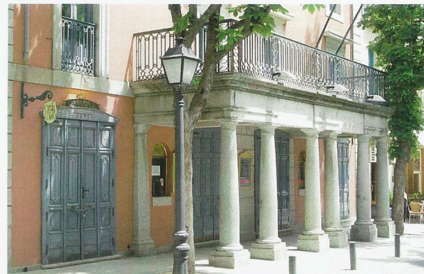
Real Coliseo Carlos III

Concebido por Jaime Marquet entre 1.770 y 1.771 para la diversión de los señores y damas de la Corte. Sobre su distribución rectangular se inscribe una "U" que configura el patio de butacas. Encima dos niveles de palcos y uno de anfiteatros. Todo ello totalmente cubierto, hecho este todavía novedoso en su época. El conjunto permitía alcanzar una capacidad para quinientos espectadores. En 1.980 la rehabilitación del edificio fue galardonada con el Premio Nacional de Restauración y en 1.995 recibió la declaración como Bien de Interés Cultural en la categoría de Monumento.