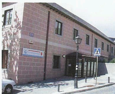
Hospital San Carlos

El arquitecto Juan Esteban vela por su cumplimiento y proyecta un trazado urbano ortogonal impuesto por el Monasterio, adaptándolo a la topografía del terreno y a las irregulares manzanas preexistentes. A él se deben obras como la Casa Grande del Común (en el solar del actual Ayuntamiento), la Real Ballestería, la Casa de los Perros, el Hospital de San Carlos (1.771) (13), la Casa para arrendar de Felipe Díaz Bamonte (1.771) (14) y las Cocheras de Su Majestad (1.772) (17). Otro arquitecto, Jaime Marquet, se encarga de las obras del Real Coliseo Carlos III en 1.770 (11)