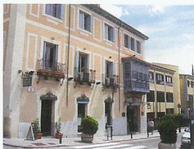
Cocheras del Rey