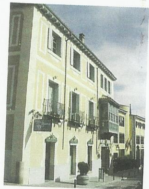
Casa Felipe Díaz y Cocheras del Rey

la proyección de un trazado urbano que continúa la ortogonalidad impuestas por el Monasterio y se adapta a la topografía del terreno y a las irregulares manzanas pre-existentes. A él se deben obras como la Casa Grande del Común (en el solar de la actual ayuntamiento), la Real Ballestería, la Casa de los Perros, el Hospital de San Carlos (1771), la Casa para arrendar de Felipe Díaz Bamonte (1771) y las Cocheras de su Majestad (1772). Juan de Villanueva, realiza numerosas edificaciones que, salpicadas en el conjunto urbano invitan al paseo y la contemplación. En 1768 la Casa del Cónsul. Un año más tarde el Palacio del Marqués de Campo Villar, La Casa de los Infantes D. Gabriel, D. Antonio Pascual y D. Francisco Javier. En 1771 realiza la Casita del Infante y probablemente, en 1774, los Cuarteles de Inválidos y Voluntarios a Caballo. A él también se deben la Tercera Casa de Oficios (1785), la Casa del Duque de Medinaceli (1785), la Casa de las Columnas o de las Tiendas (1787), la ampliación del Mercado público (1797) y otras numerosas obras arquitectónicas de la localidad. En 1971 el Casco de San Lorenzo de El Escorial obtiene la declaración de Interés Cultural con categoría de conjunto Histórico-Artístico.