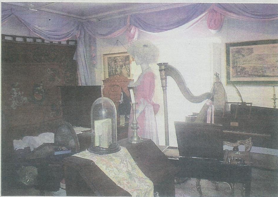
Inmensas vitrinas albergan manuscritos y ejemplares de temática muy variada. Mapas, planos, cartas, todo tipo de documentación que refleja el estilo de vida de una época. Trajes, enseres y vehículos para todas las ocasiones son algunas de las sorpresas que nos depara esta exposición, donde cada detalle ha sido minuciosamente cuidado.